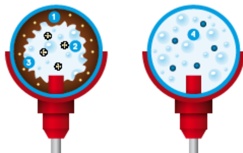
شکل ۱: مثالی شماتیک از مقایسه کارایی کلر / اسید و آکوآکلین در لوله آبرسان